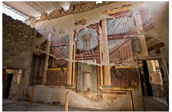
Сл. 2. Villa-di-Poppaea , фреска у главном салону

Фреске из Херкуланума, посебно оне из виле Неронове супруге ( Poppaea's villa in Oplantis ), ретко су претстављане у стручним публикацијама. Откривене су 1977. године (сл. 1). Данас су предмет интересовања два Универзитета, једног из Салерна и другог из Напуља. Развој технологије омогућио је да сада приступ њиховој анализи буде мултидисциплинаран.