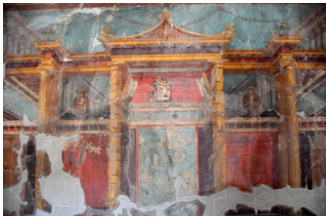
Сл. 3. а) Фреска из салона Pomegranates

Употреба иновативних технологија омогућава нам да данас, док посматрамо ова ремек-дела, имамо нови визуелни доживљај. Остварен је помоћу повезивања реалног простора и оног насликаног, уз очигледан утицај представљене сликане архитектуре на изграђени стварни простор у коме је стварана фреска.