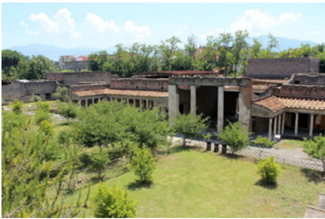
Сл. 1. Улаз са вртом, Poppaea's villa , Оплантис, фото: Miguel Hermoso Cuesta, wikimedia.org