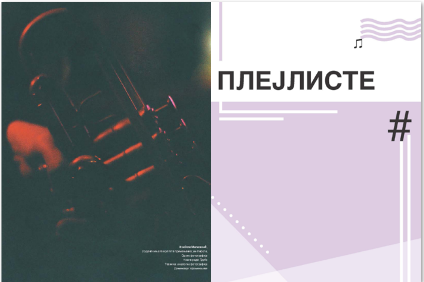
Странице из часописа, са фотографијом Изабеле Милановић ( Труба , аналогна фотографија)

Публикација је доступна на сајту Факултета, на страници посвећеној електронским издањима Центра за издавачку делатност ФМУ