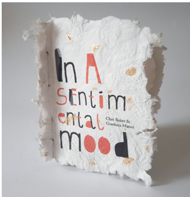
Вања Бајовић, In A Sentimental Mood