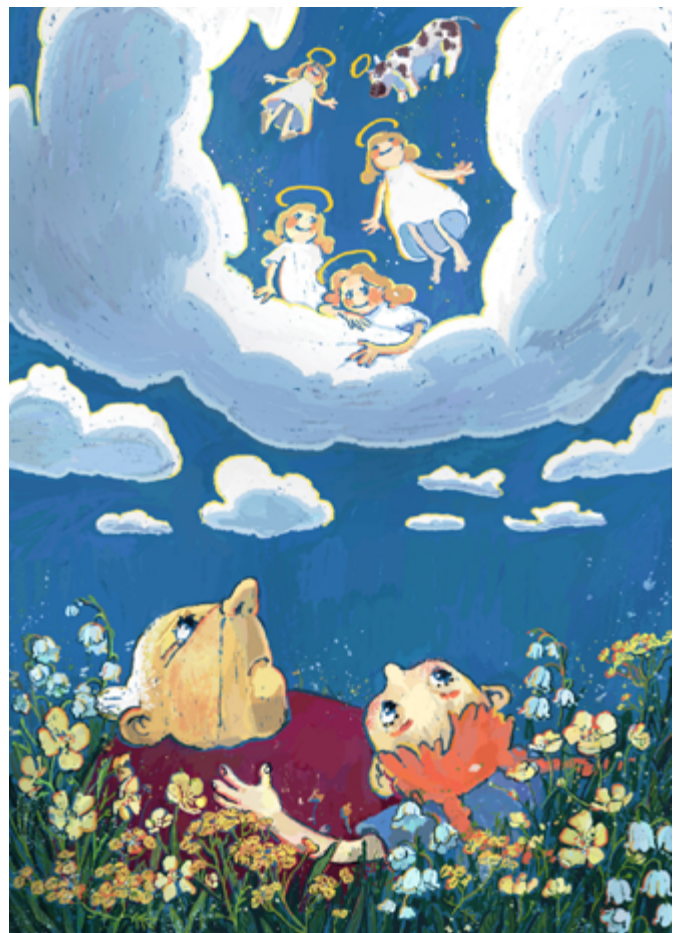
Бојан Завишин, графика и књига, IV