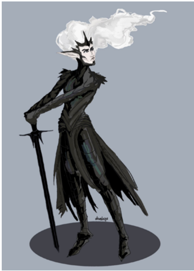
Невена Цаклић, графика и књига, IV