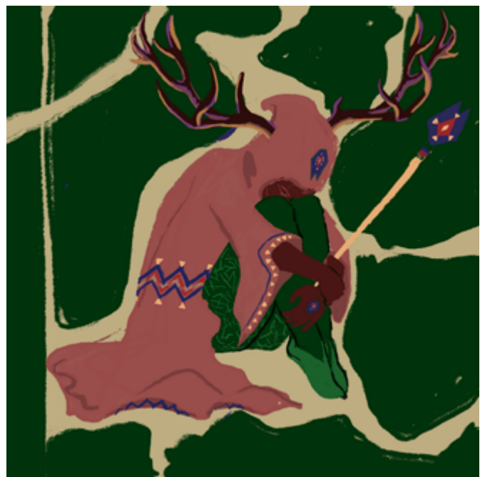
Миона Рацић, фотографија, IV